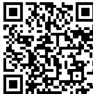
Instagram Zukunft Tandern

Wir freuen uns, Dich bei Zukunft Tandern e.V. begrüßen